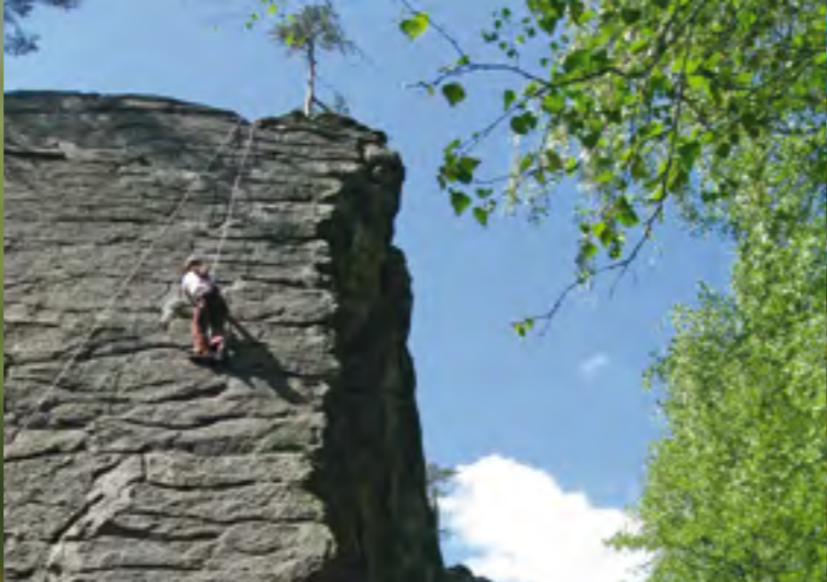
Klettern im Fichtelgebirge