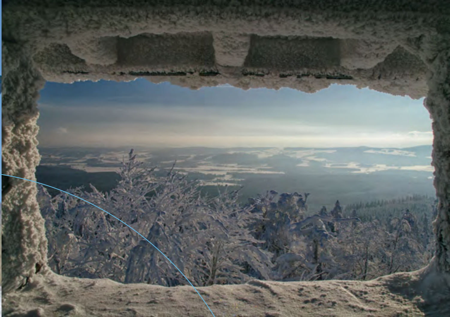
Ausblick vom Kösseineturm