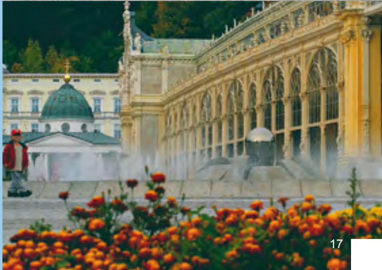
Marienbad, Bild rechts Eger, Bild rechts Mitte