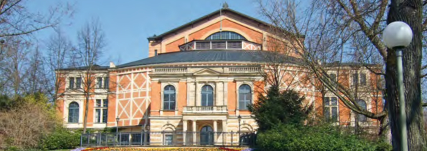
Bayreuth Festspielhaus, Bild oben Marienbad, Bild rechts oben