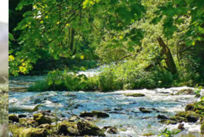
Bachlauf im Fichtelgebirge