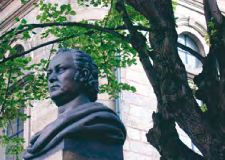
Jean Paul Statue in Wunsiedel