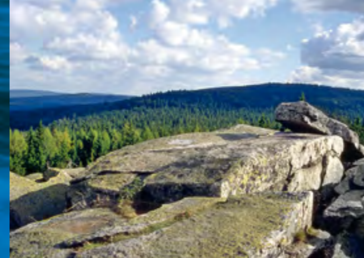
Blick von der Platte über den Seehügel zum Waldstein

Beginnen Sie ihr Entspannungswochenende mit einem Spaziergang um den Weißenstädter See. Genießen Sie direkt am Wasser die Nachmittagssonne bei Kaffee und Kuchen und lassen Sie sich von der „Poesie am See“ inspirieren: Auf 14 hohen Granitstelen, die in unterschiedlichen Abständen am Ufer aufgestellt sind, ist „Das Stundenbuch“, eine außergewöhnliche Gedichtsammlung von Eugen Gomringer, verewigt. Beim gemütlichen Abendessen in uriger Stube empfängt Sie die fränkische Kochkunst mit Produkten der Region wie dem „fränkischen Schnitz“, einem zarten Filet vom Fichtelgebirgsweiderind oder einer der vielfältigen Kräuterspezialitäten.