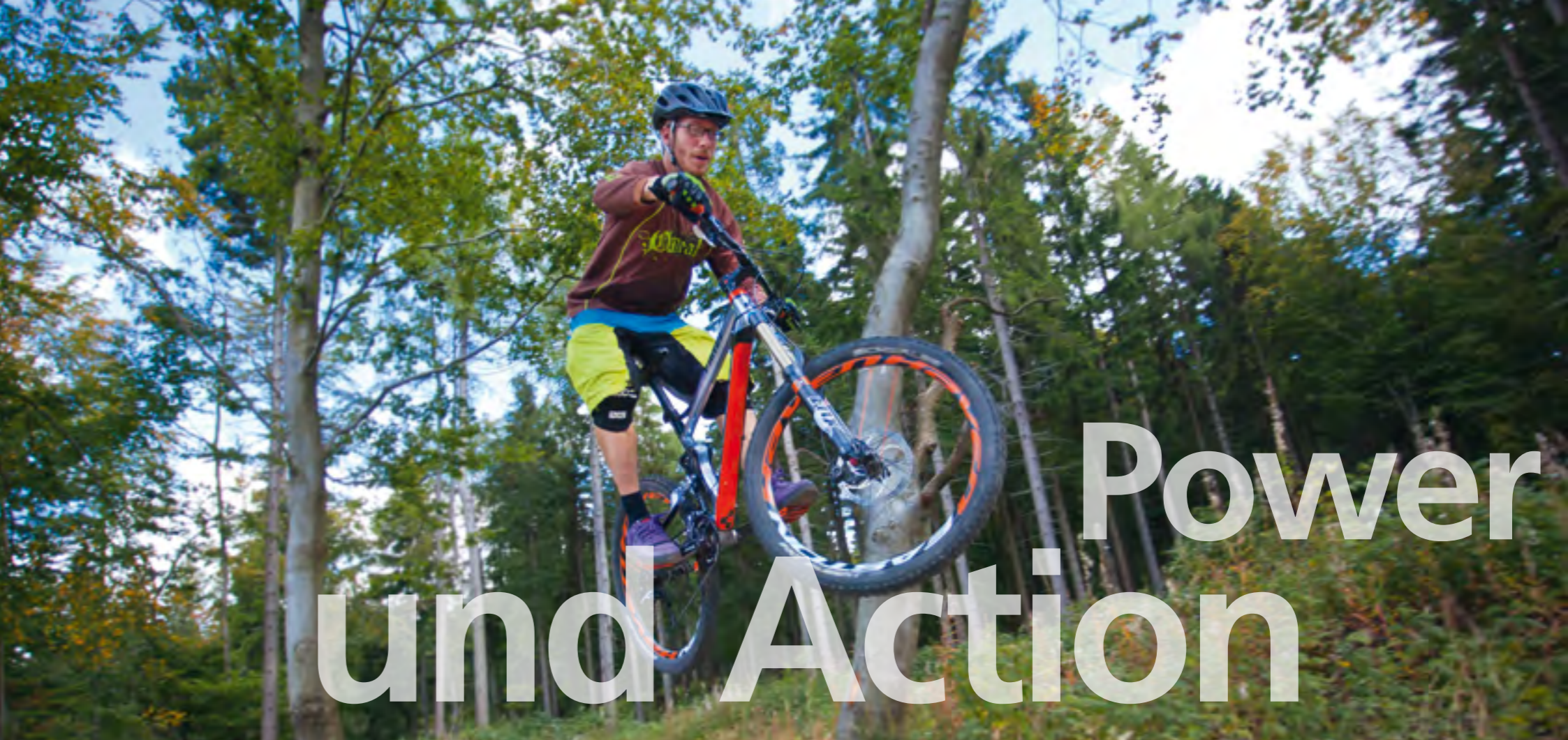
Downhill am Ochsenkopf