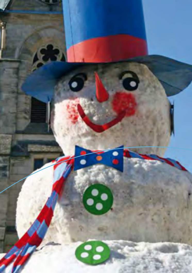
Schneemannbauen in Bischofsgrün