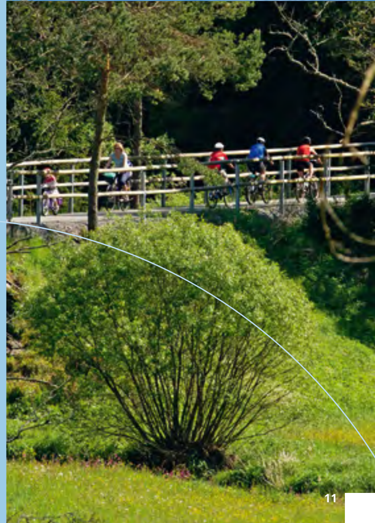
Blick über den Weißstädtter See, Bild oben Brückenradweg Tröstau -Asch, Bild rechts