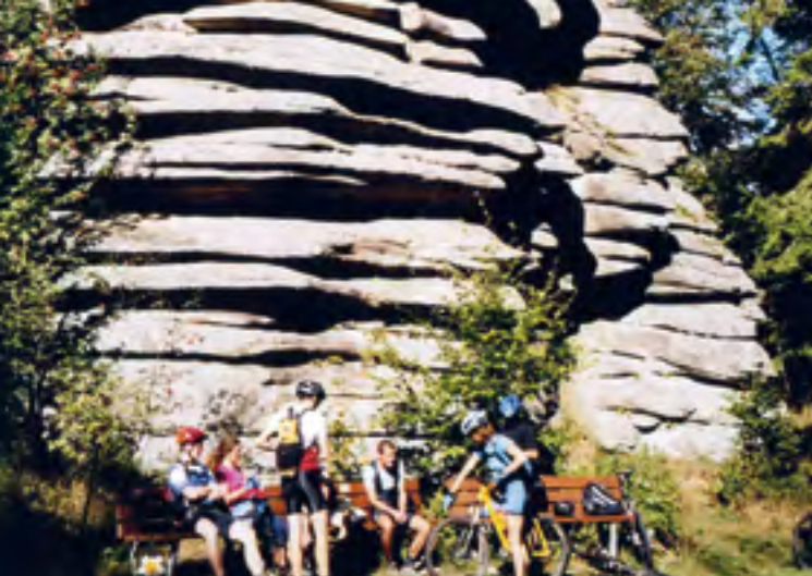
Felsformation im Fichtelgebirge